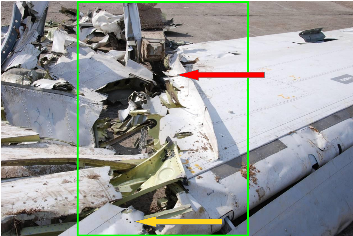
Zdjęcie DSC_0173, wykonane przez członków KBWLLP 19.04.2010 – strzałką żółtą pokazano poszarpany fragment slotu (przedniej krawędzi), strzałką czerwoną przecięcie tylnej części skrzydła