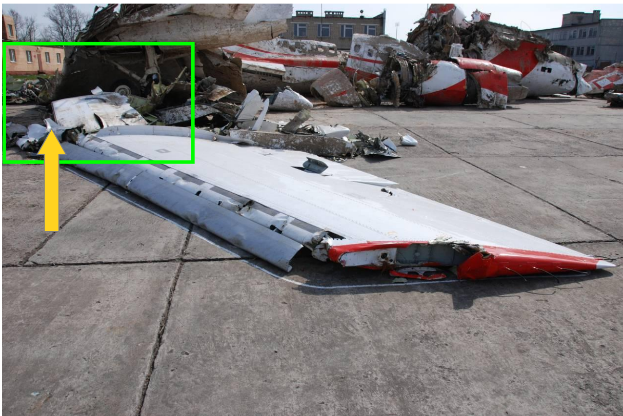
Zdjęcie DSC_0175, wykonane przez członków KBWLLP 19.04.2010